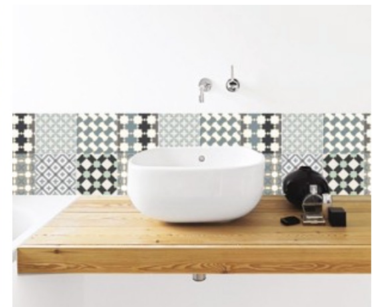
CRÉDENCE ADHÉSIVES, LE GRAND CIRQUE