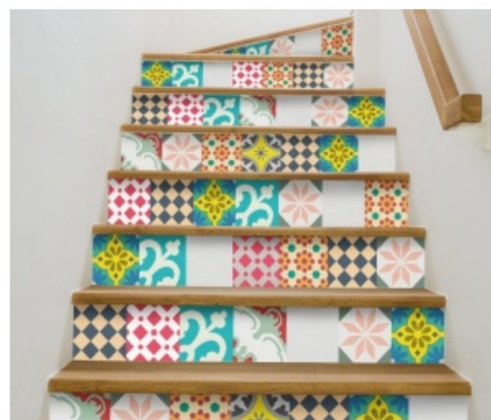
CONTREMARCHES, MA PLINTE DÉCO