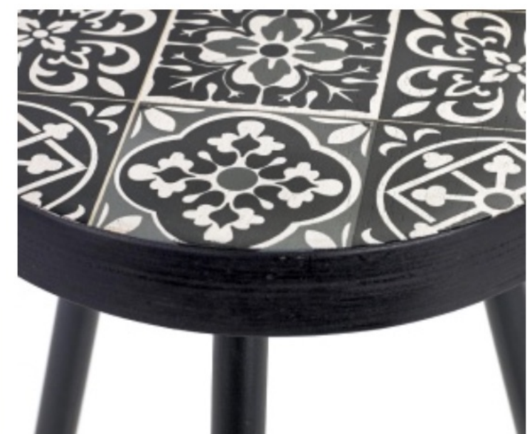
PLATEAU DE TABLE BASSE, SERAX