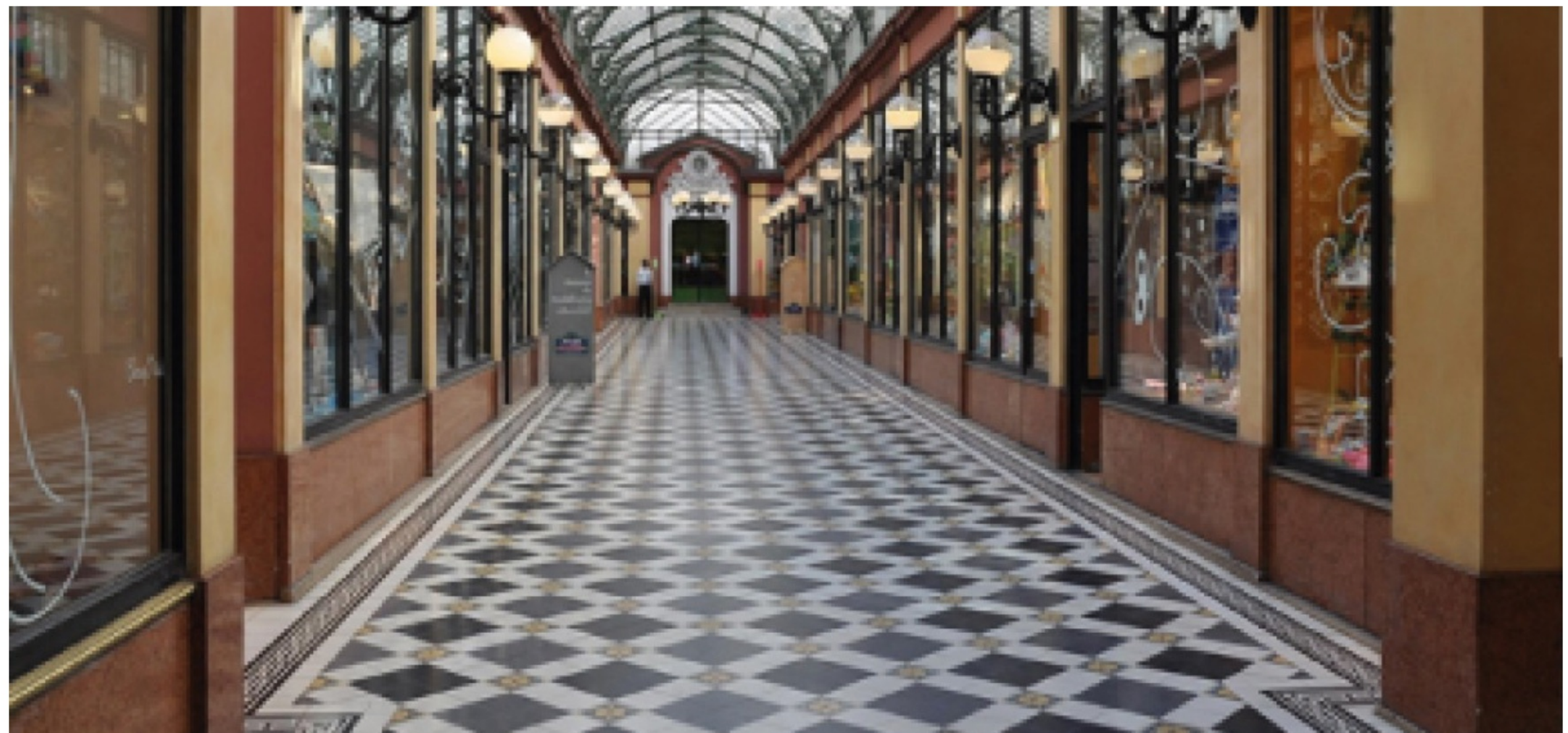
RÉALISATION CARRELAGE DU MARAIS

Vous y verrez notamment ses dernières réalisations ainsi que son parcours.