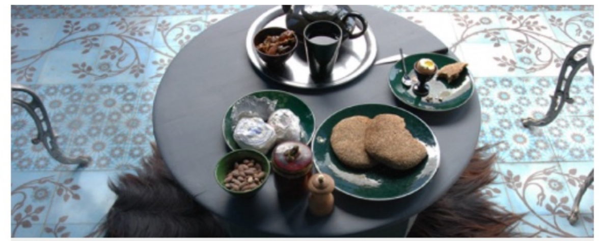
EMERY & CIE