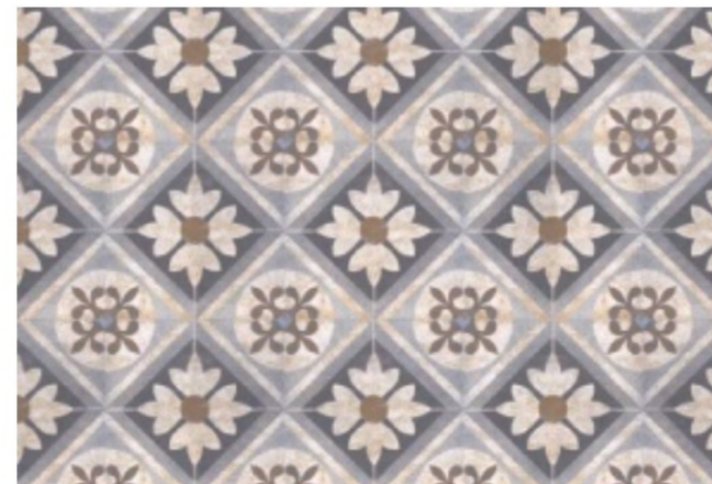
CARRELAGE 60X60CM, HIDRAULICO, PAVIGRES