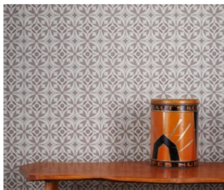
PAPIER PEINT ELMAS, AKIN & SURI