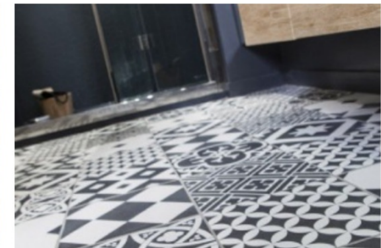
CARRELAGE 20X20CM, GATSBY, LEROY MERLIN