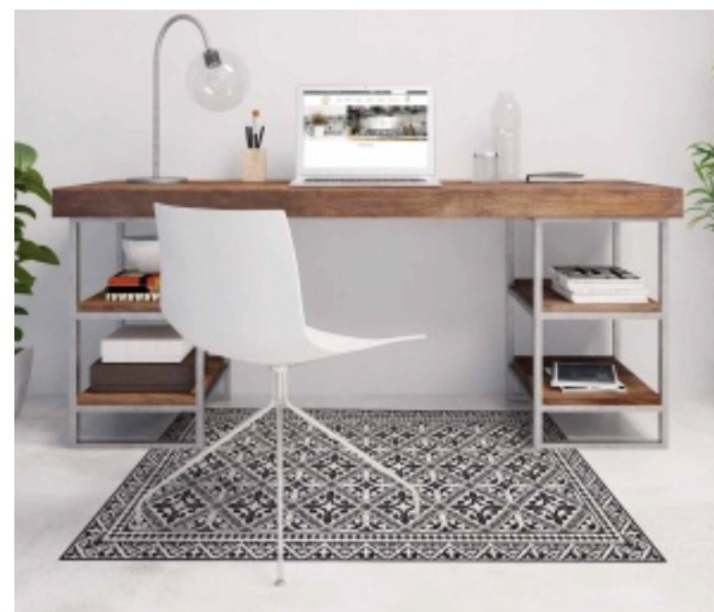
TAPIS VINYLE BEIJA FLOR