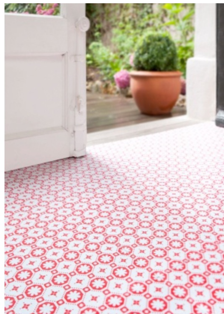
CHIARA STELLA HOME